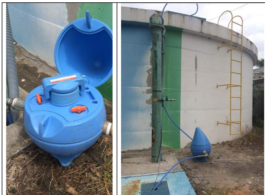
Figura 1: Dosador hidráulico instalado no reservatório estudado.

O dosador hidráulico testado foi o modelo GUTWASSER, da Empresa LICS Superágua (Figura 1). Para a vazão mencionada (123 m 3 /dia), verificou-se que apenas um equipamento era suficiente, pois a vazão encontra-se dentro da faixa recomendada pelo fabricante.